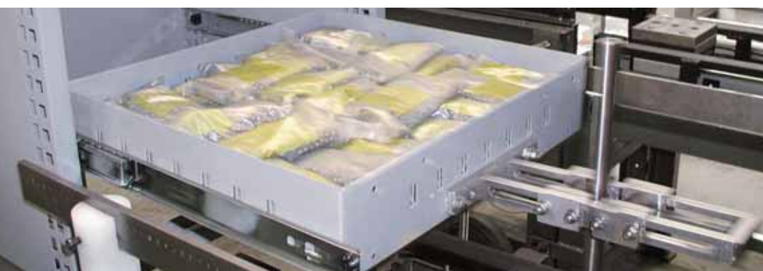
Test dinamico e di fatica con prova di resistenza allo strappo

La sicurezza si ottiene anche nella cura dei dettagli. Quando sono necessarie stabilità e leggerezza contemporaneamente, la scelta dei materiali diventa importante. Con la giusta combinazione di materiali quali acciaio, alluminio e plastica, le nostre strutture soddisfano pienamente le necessità di carico.